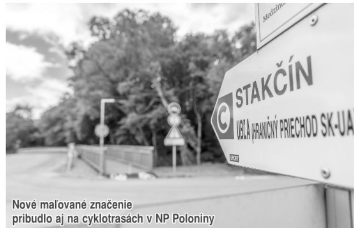
Nové maľované značenie pribudlo aj na cyklotrasách v NP Poloniny