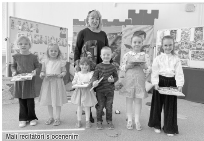
Malí recitátori s ocenením