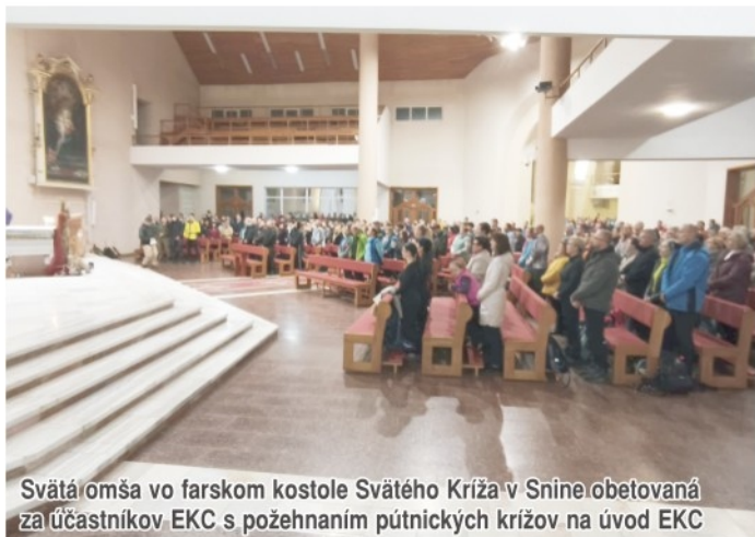
Svätá omša vo farskom kostole Svätého Kríža v Snine obetovaná za účastníkov EKC s požehnaním pútnických krížov na úvod EKC