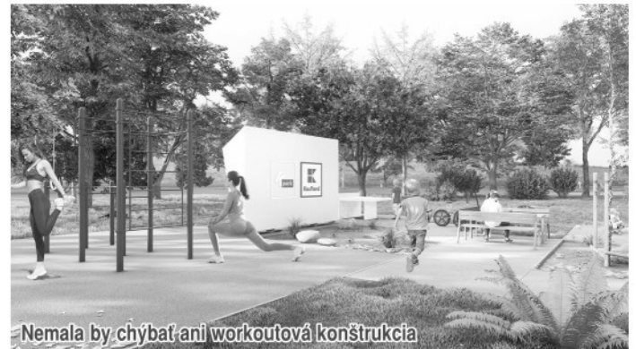
Nemala by chýbať ani workoutová konštrukcia