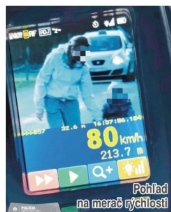
Pohľad na merač rýchlosti

Krajské riaditeľstvo Policajného zboru Slovenskej republiky Prešov