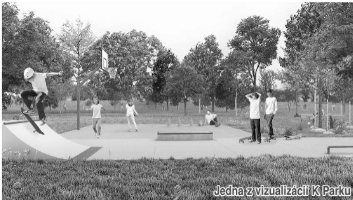
Jedna z vizualizácií K Parku