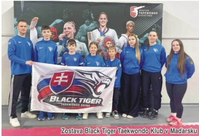
Zostava Black Tiger Taekwondo Klub v Maďarsku