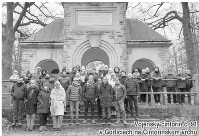
Vojenský cintorín č. 91 v Gorliciach na Cintorínskom vrchu