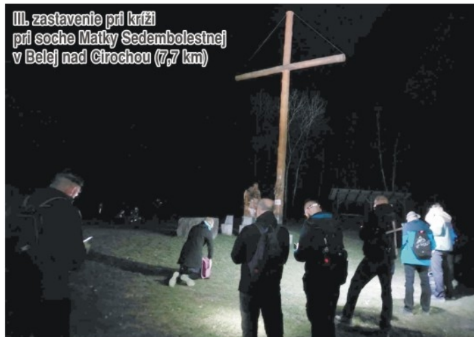
III. zastavenie pri kríži pri soche Matky Sedembolestnej v Belej nad Cirochou (7,7 km)

Pozvánku a základné informačné údaje o Extrémnej Krížovej Ceste Snina (EKC) sme uverejnili v Sninských novinách číslo 8 (16. februára 2026). Konala sa z piatka 20. marca na sobotu 21. marca.