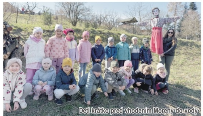
Deti krátko pred vhođením Moreny do vody

Tento zážitok bol pre deti nielen zábavný, ale aj poučný, pretože si priblížili tradície našich predkov a pocítili čaro prichádzajúcej jari. MŠ Perečinska