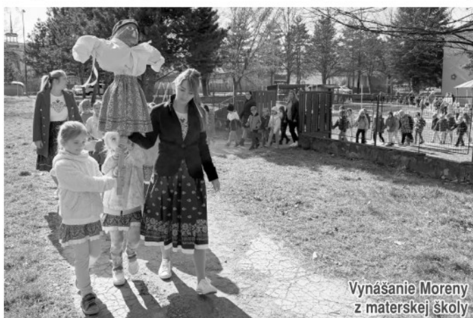
Vynášanie Moreny z materskej školy

v Snine si deti spolu so svojimi učiteľkami pripomenuli jeden z tradičných jarných zvykov - vynášanie Moreny, ktorým symbolicky privítali prichádzajúce jarné obdobie a rozlúčili sa so zimou. Morena, vyrobená z prírodných materiálov, predstavovala zimu a všetko chladné, čo k nej patrí. Deti ju v sprievode doprevádzali jednoduchými riekankami a pesničkami. Po vynešení von nasledovalo jej upálenie a následné hodenie do neďalekej rieky.