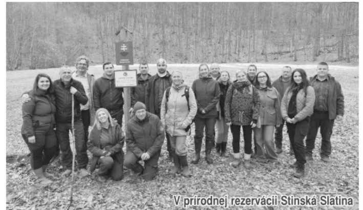
V prírodnej rezervácii Stinská Slatina