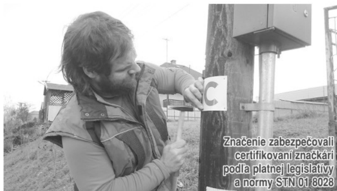
Značenie zabezpečovali certifikovaní značkári podľa platnej legislatívy a normy STN 01 8028

KOČR Severovýchod Slovenska, Oddelenie komunikácie Prešovského samosprávneho kraja