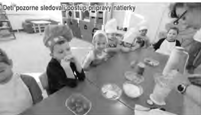
Deti pozorne sledovali postup prípravy nátierky