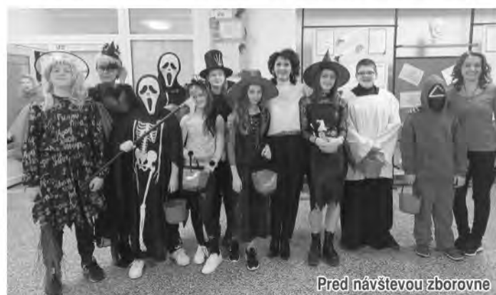
Pred návštevou zborovne