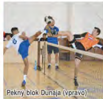
Pekný blok Dunaja (vpravo)