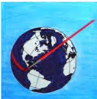
Sergej Pastorok - Prešov