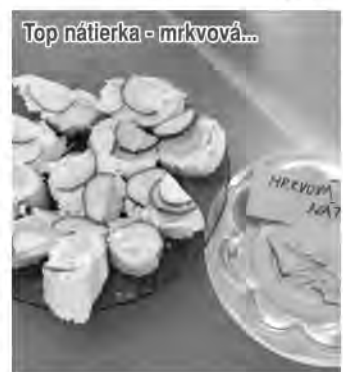
Top nátierka - mrkvová...