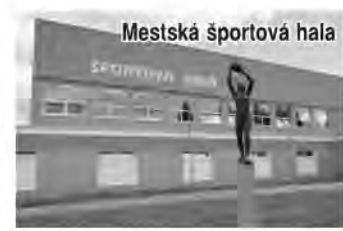
Mestská športová hala