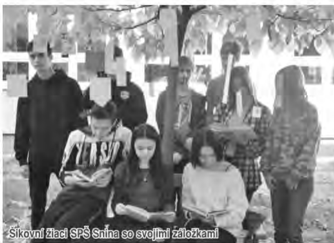
Síkovní žiaci SPŠ Snina so svojimi záložkami

Jednou z tvorivých aktivít bola aj výroba zaujímavých záložiek v rámci projektu pre stredné školy „Záložka do knihy spája slovenské školy“ s podtitulom „Významné osobnosti slovenskej literatúry - Pavol Országh Hviezdoslav (100. výročie úmrtia) a Božena Slančíková-Timrava (70. výročie úmrtia)“, ktorý vyhlásila už po desiatykrát Slovenská pedagogická knižnica v Bratislave. Cieľom projektu je nadviazať kontakty medzi slovenskými strednými školami a podpora čítania prostredníctvom výmeny záložiek do