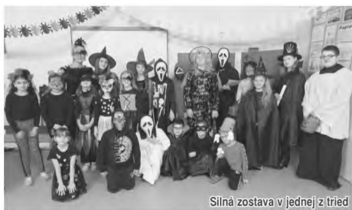
Silná zostava v jednej z tried

Renault care service dlhý život pre vaše vozidlo