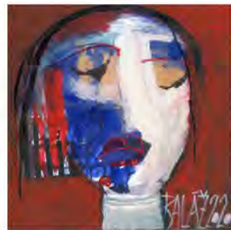
Dušan Baláž - Slovensko