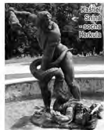
Kaštieľ Snina - socha Herkula

07. 11. - René - má latinský pôvod. V preklade znamená "znovuzrodený". Pôsobí neodolateľne, aj keď väčšinou ide iba o pozlátku. Postupom času sa z neho stane vypočítavec, ktorý svojím šarmom a úsmevmi dokáže využívať doslova každého. Každý je rád v jeho spoločnosti. Známosť s ním je prestížnou záležitosťou. Málo dáva, ale veľké berie, ale so šarmom a jemnosťou. Je neodolateľný a vždy uspeje.