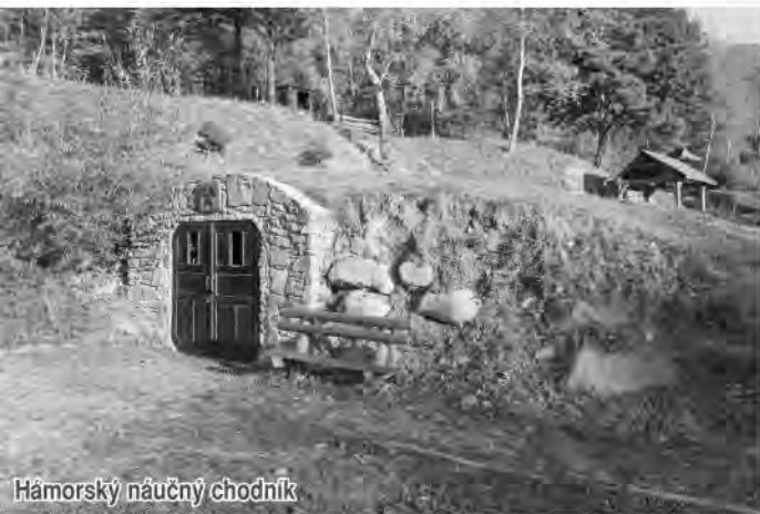
Hámorský náučný chodník