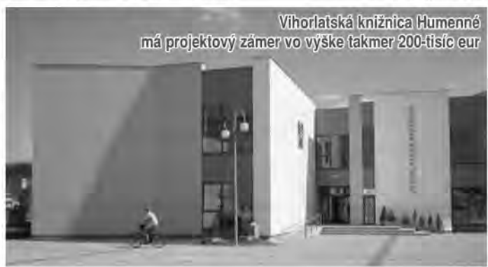
Vihorlatská knižnica Humenné má projektový zámer vo výške takmer 200-tisíc eur

Lea Heilová, Oddelenie komunikácie a propagácie PSK