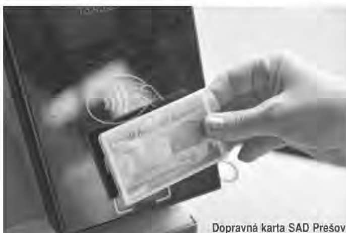
Dopravná karta SAD Prešov

Dopravné karty vydávali zdarma zmluvní autobusoví dopravcovia Prešovského kraja - BUS Karpaty vydal 64 kariet, SAD Humenné 325, SAD Poprad 400 a SAD Prešov 685 kariet. Aj v Košickom kraji si mohli cestujúci vybrať bezplatne dopravné karty u svo-