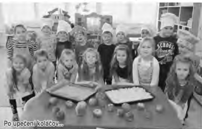
Po upečení koláčov...