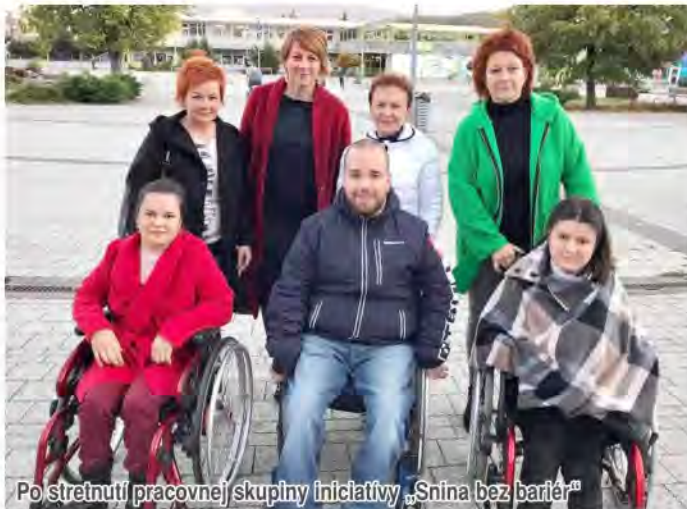
Po stretnutí pracovnej skupiny iniciatívy „Snina bez bariér“

Skupina pracuje na zjednodušení života pre zdravotne znevýhodnených