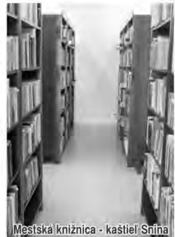
Mestská knižnica - kaštieľ Snina

31. 10. - Aurélia - má latinský pôvod, v preklade znamená "zlatá". Má stále otvorené uši a oči. Radšej riadi a využíva dobrotu iných, diplomaticky a nenápadne. Jej okolie ani netuší, že je využívaná.