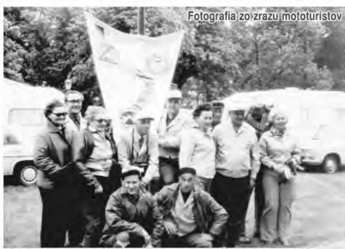
Fotografia zo zrazu mototuristov