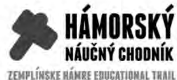
ZEMLÍNSKE HÁMRE EDUCATIONAL TRAIL