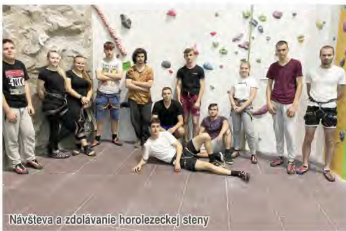
Návšteva a zdolávanie horolezeckej steny

Čo dodať na záver? Okrem vyššie spomínaných skúseností, atrakcií a zážitkov si domov priniesli aj certifikáty o absolvovaní programu Erasmus+ a pamätné darčeky. Aj napriek opatreniam s koronavírusom bol program Erasmus+ v poľskom meste Vroclav úspešný a žiaci tak získali cenné skúsenosti, ktoré im už nikto nemôže vziať. (soš)