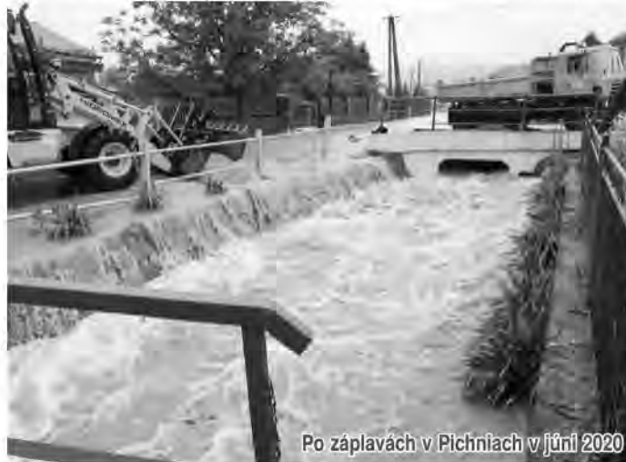
Po záplavách v Pichniach v júni 2020