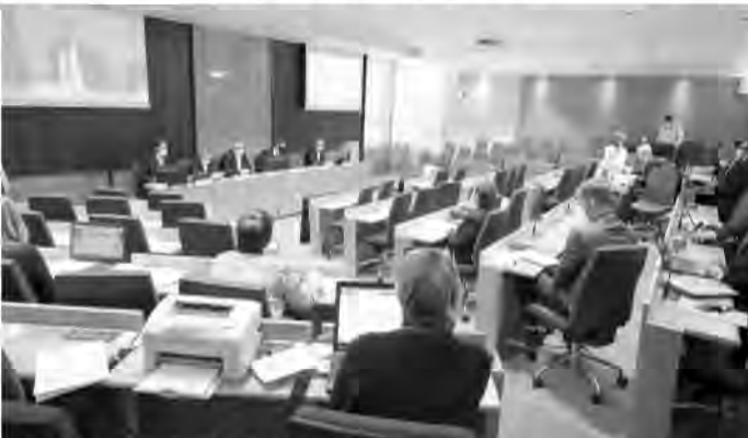
Rokovanie Zastupiteľstva PSK formou videokonferencie

*Predám smrek tatranský obklad, 5,59- €, leštený, zrubový polguľatý profil, hranoly a dlážkovicu na podlahy - "dyle". 0907 233 415