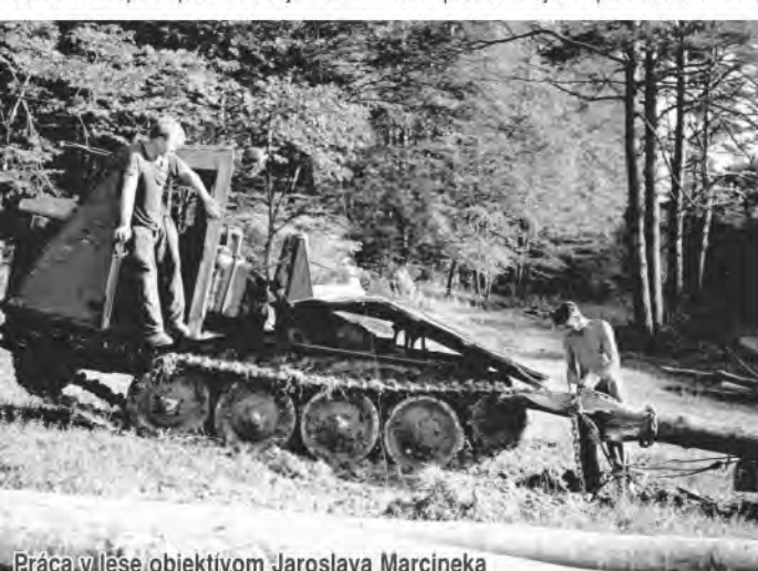
Práca v lese