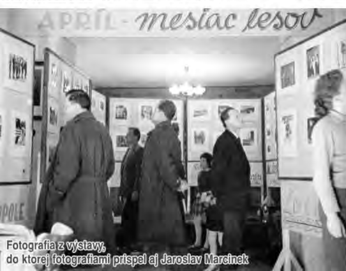
Fotografia z výstavy, do ktorej fotografiami prispel aj Jaroslav Marcinek