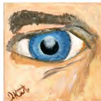
Dagmar Rostand - B. Bystrica