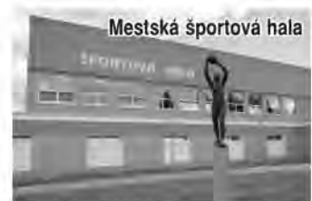
Mestská športová hala