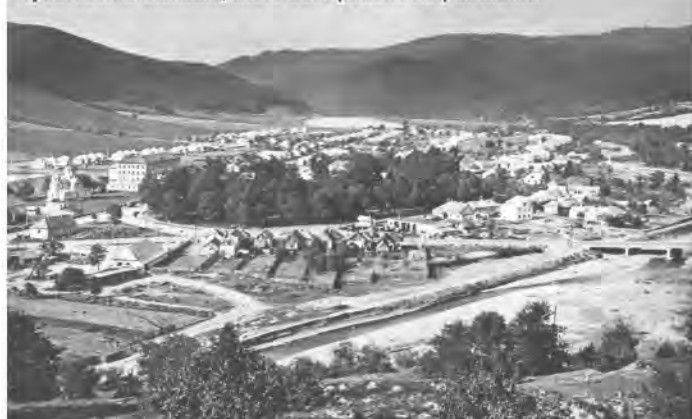
Vyobrazenie Stakčína, ktoré bolo použité na pohľadnici