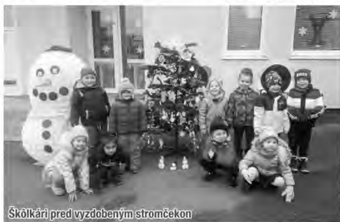
Škôlkári pred vyzdobeným stromčekom