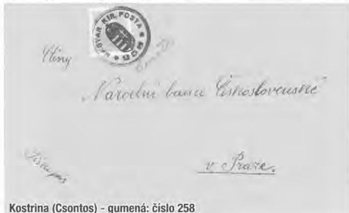
Kostrina (Csontos) - gumená: číslo 258