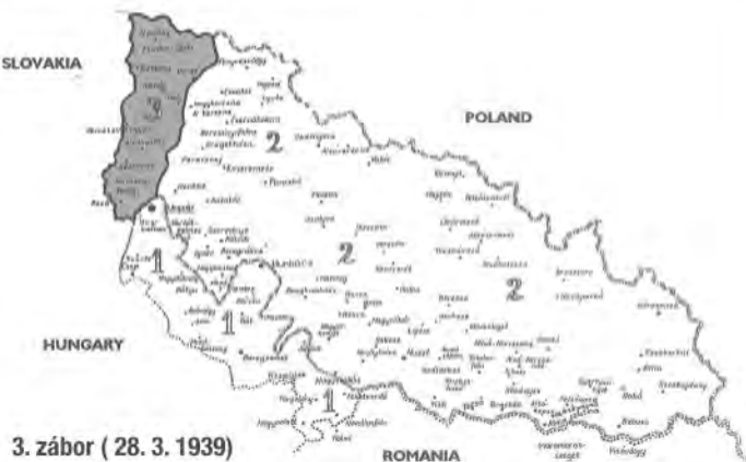
3. zábor (28. 3. 1939)