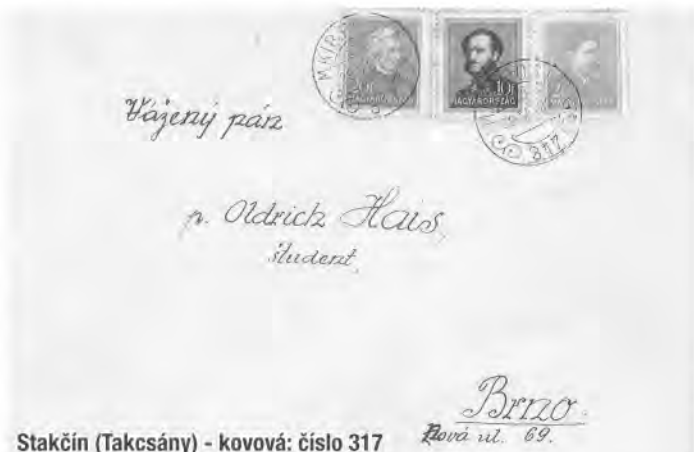
Stakčín (Takcsány) - kovová: číslo 317