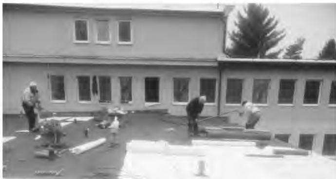
Pokládka nového prekrytia