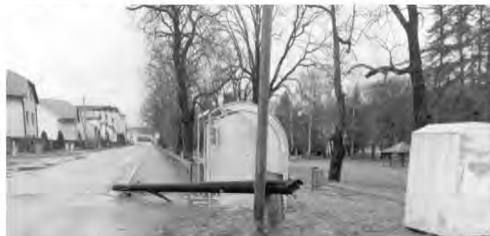
Zlomený stĺp elektrického vedenia na Sládkovičovej ulici