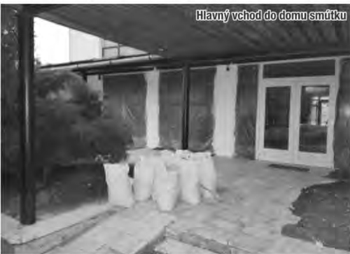
Hlavný vchod do domu smútku

EUR. Plánované ukončenie prác, ktoré intenzívne prebiehajú, je do konca roka 2020. (msú)