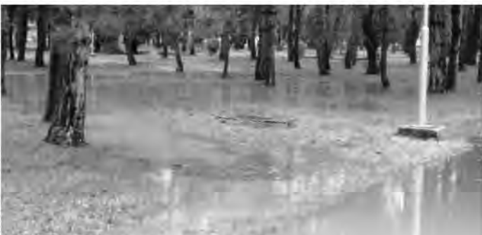
Zaplavený Vihorlatský park

Veternou smršťou boli poškodené viaceré stromy vo vihorlatskom aj historickom parku a zlomený stĺp elektrického vedenia. (ejan)