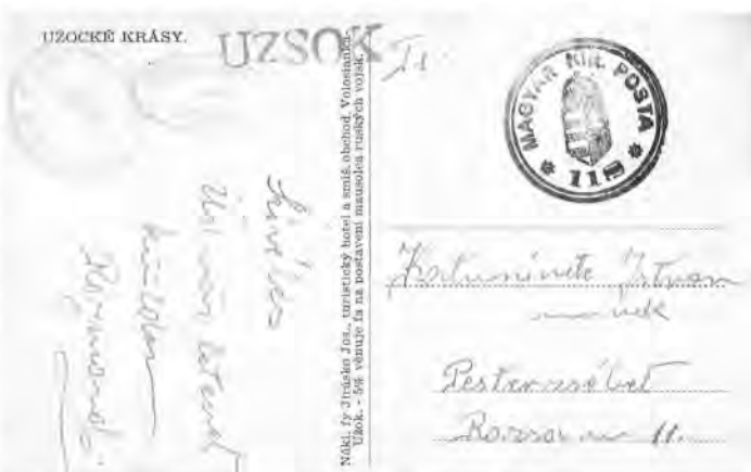
Veľký Berezný (Nagyberezna) - gumená: číslo 118

Vznikla zvláštna situácia: Toto územie bolo rozhodnutím Mierovej konferencie z roku 1919 priradené Slovensku, ale po územných reformách v 20. rokoch minulého storočia bolo administratívne pričlenené k Podkarpatskej Rusi. S podobnými problémami územných úprav v rámci uceleného štátu, ktoré po rozdelení spôsobujú problémy, sme sa mohli stretnúť napríklad v nedávnej dobe v prípade obce Sidónia/Sidonie na moravsko-slovenskom pomedzí, kde sa v rámci Československa budovali siete z oboch strán republiky, a kde to bolo najjednoduchšie, ale po rozdelení vznikol problém, či obec zaradiť podľa