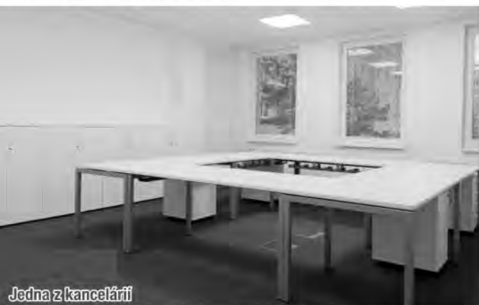
Jedna z kancelárií