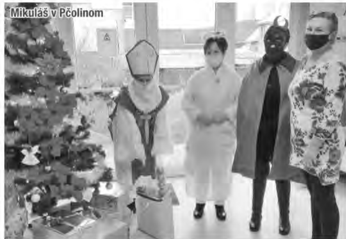
Mikuláš v Pčolinom