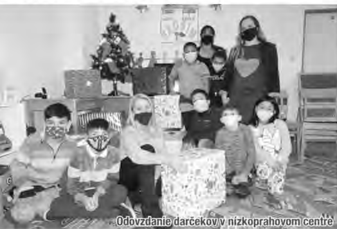
Odovzdanie darčekom v nízokoprahovom centre

Hračky v darčekom balení sme odovzdali sociálnym pracovníčkam v nízokoprahovom centre, rovnako ako sme im odovzdali v marci rúška, pre tých, ktorí to vtedy najviac potrebovali. Všetci pamätajme na to, že čo dávame, to sa nám vracia a preto v tomto novoročnom čase posielam v mene celého kolektívu balíčok úsmevov