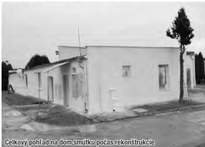
Celkový pohľad na dom smútku počas rekonštrukcie