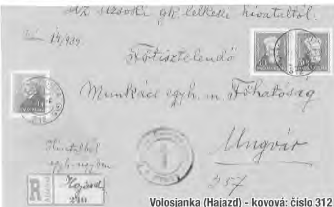
Volosjanka (Hajzsd) - kovová: číslo 312