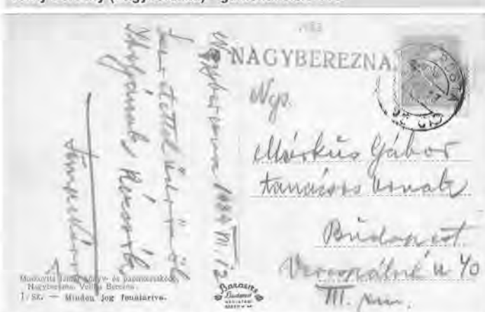
Veľký Berezný (Nagyberezna) - kovová: číslo 102

cesty, alebo inžinierskych sietí. Toto sa nakoniec vyriešilo našťastie kultúrne, na rozdiel od posunu hraníc vo veľkom Sojuze, kde Generalissimus posúval hranice medzi jednotlivými štátmi, z čoho vznikli dnes v podstate celosvetové problémy. Ako príklad Krym, Osetsko, Abcházsko, Náhorný Karabach,... Treba podotknúť, že maďarské zábery boli dopredu dôsledne pripravené: Armáda (zväčša na koňoch) so sebou viezla nielen maďarské poštové známky, ale aj provízorne poštové pe-