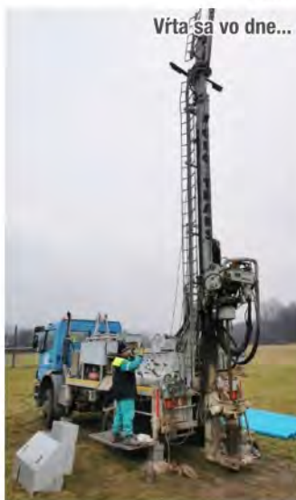
Vŕta sa vo dne...

v Uličskom Krivom, *100 metrov hlboký prieskumný vrt v Novej Sedlici, *overí sa výdatnosť prameňa v obci Zboj, *overí sa výdatnosť jestvujúceho vrtu