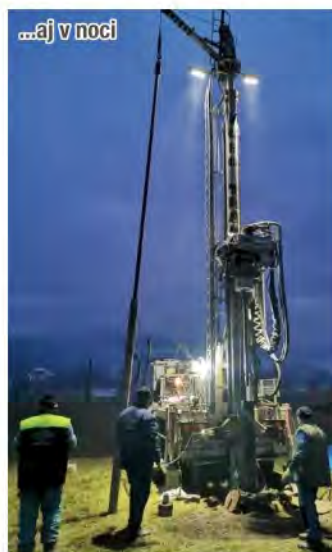
...aj v noci

v Uličskom Krivom, *100 metrov hlboký prieskumný vrt v Novej Sedlici, *overí sa výdatnosť prameňa v obci Zboj, *overí sa výdatnosť jestvujúceho vrtu