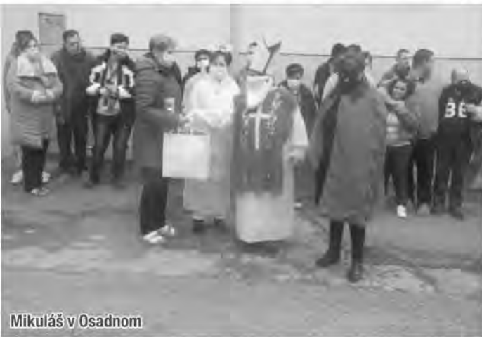
Mikuláš v Osadnom