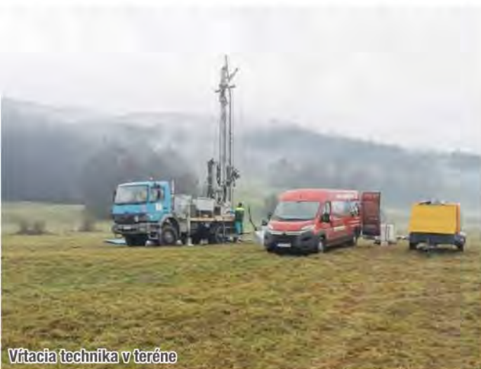
Vŕtacia technika v teréne

V okrese Snina aktuálne prebieha realizácia prieskumných vrtov v Zbojskej doline. Ide o overenie možnosti zabezpečenia vodných zdrojov pre obce Uličské Krivé, Zboj a Novú Sedlicu.